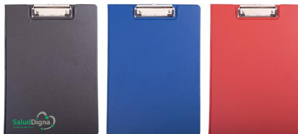
Tabla de madera MDF para documentos, con clip metálico para sujetar hojas.